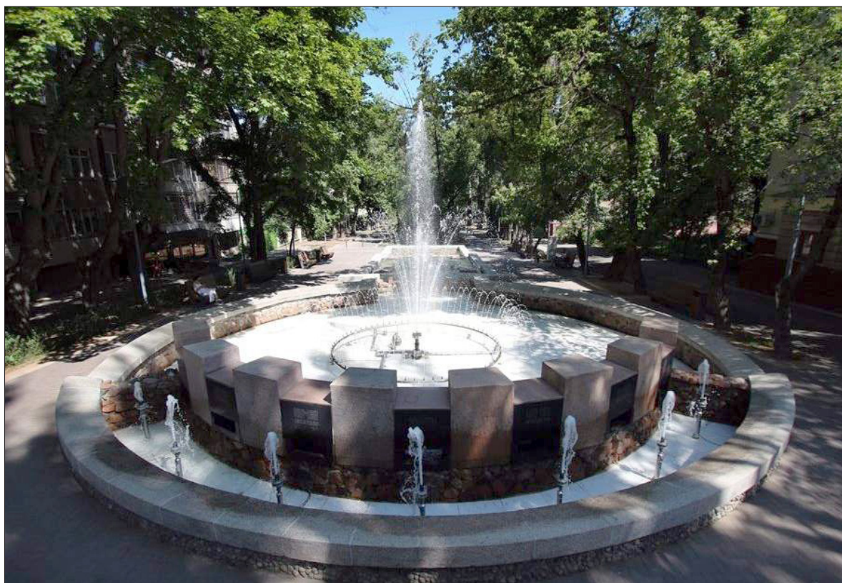
Рис. 1. Фонтан «Жетысу» в г. Алматы. Архитектор М. К. Сафин, 1970 г. (по: https://vlast.kz/gorod/29061-novye-starye-fontany.html )

Нужно заметить, что вплоть до нынешнего времени проблема происхождения обоих названий не становилась предметом специального исследования профессиональных историков, востоковедов, хотя многие учёные XIX–XX вв. в своих трудах затрагивали вопросы географического содержания данных топонимов. Все известные на сегодня попытки истолкования ис-